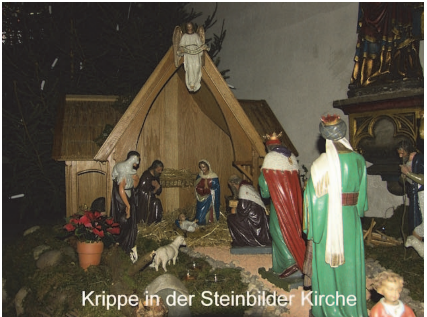
Krippe in der Steinbilder Kirche