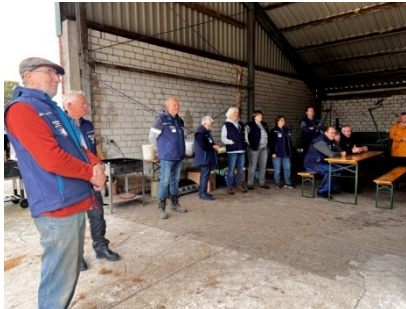
Die Helfer vom Oldtimerclub