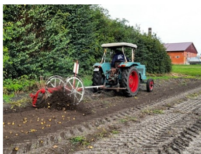
Der alte Schleuderröder