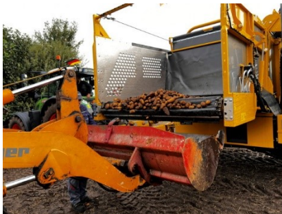
Die „Ausbeute“ des Vollernters