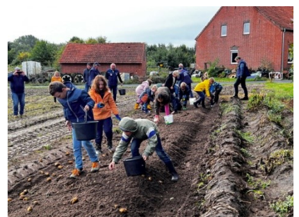
Bei der Arbeit