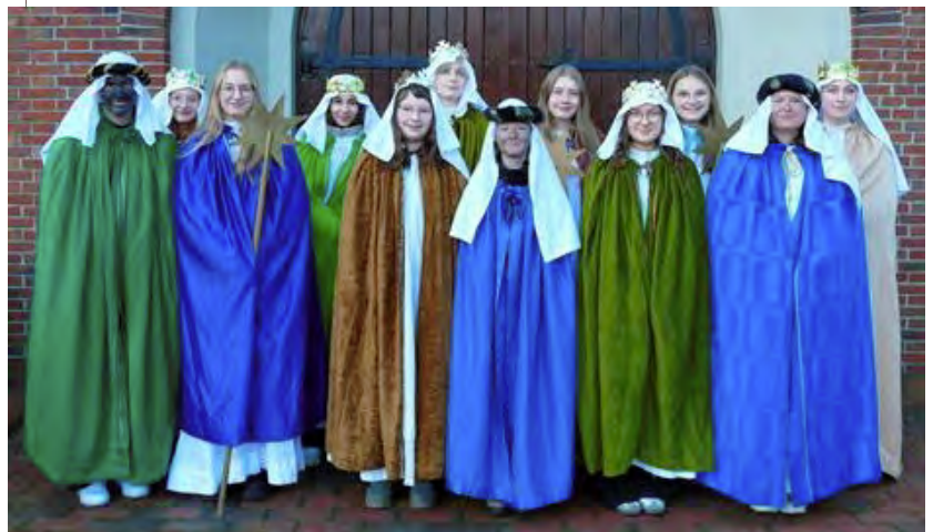
Foto: Die Sternsinger in Hasselbrock verkündeten die Botschaft von der Geburt Jesu und schrieben den Segensspruch an die Häuser.

Im Fokus der Sternsingeraktion 2024 unter dem Motto „Gemeinsam für unsere Erde in Amazonien und weltweit“ stehen die Bewahrung der Schöpfung und der respektvolle Umgang mit Mensch und Natur in den südamerikanischen Ländern Amazoniens, wo durch Brandrodung, Abholzung und rücksichtslose Ausbeutung von Ressourcen die Lebensgrundlage der einheimischen Bevölkerung ruiniert wird. Dort und an vielen anderen Orten der Welt setzen sich die Partnerorganisationen der Sternsinger dafür ein, dass das Recht der Kinder auf eine geschützte Umwelt umgesetzt wird.