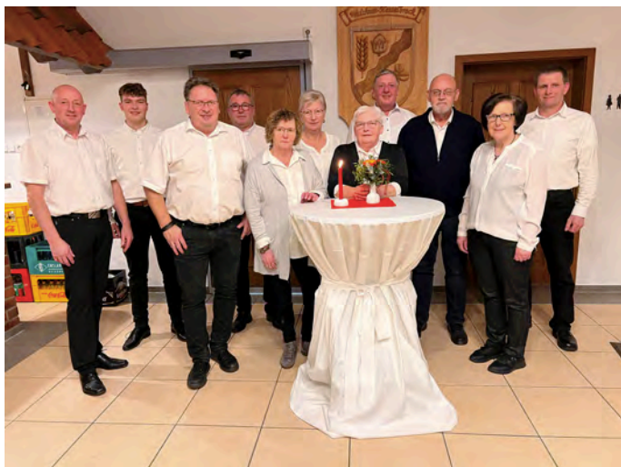
Foto links: Das „Theken- und Küchenpersonal“ bedient nun schon 15 Jahre lang die Gäste beim Neujahrsempfang.