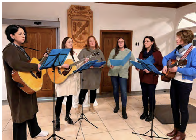
Foto oben: Die Gitarrengruppe Walchum feierte ihr 20-jähriges Bestehen und bereicherte schon rund zehn Mal den Neujahrsempfang mit ihren Liedern.